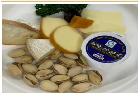
チーズ盛り合わせ 3ポイント