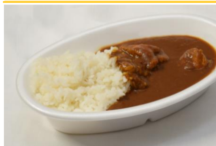
日本平ホテル特製シュリンプカレー 3ポイント