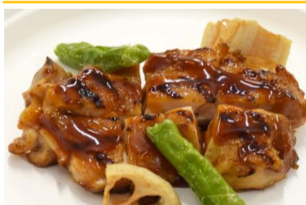
チキンの網焼き 照り焼きソース 2ポイント