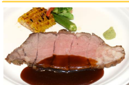
ローストビーフ ジンジャーソース 5ポイント