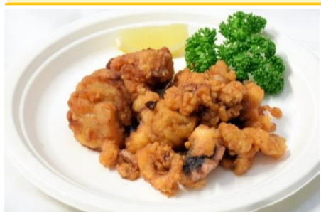
チキンの唐揚げ&タコ唐揚げ 3ポイント