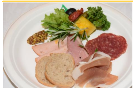
サラミ・コールドミート盛り合わせ 3ポイント