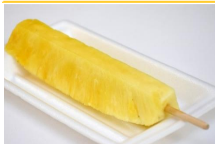
カットパイ 1ポイント