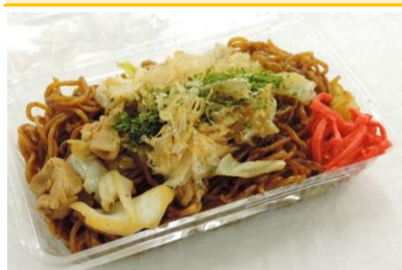
お好みソース焼きそば 2ポイント