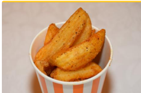
フライドポテト 1ポイント