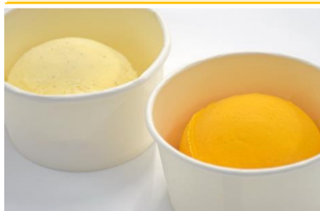
マンゴーシャーベット・バニラアイス 各1ポイント