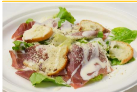
パルマ産生ハムシーザーサラダ 3ポイント