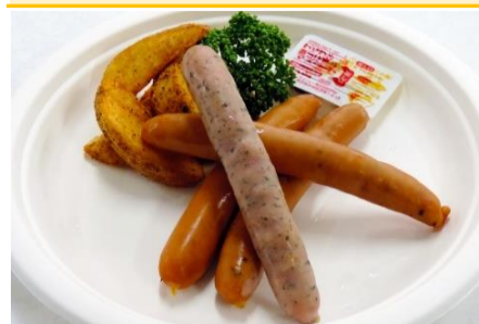
ソーセージ盛り合わせ 3ポイント